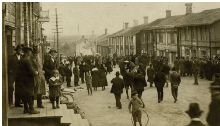
Kyrkhelg i Vilhelmina i början av 1900-talet.

Så kom då den ödesdigra dagen när mer än halva kyrkstaden brann ner till grunden. Det var på morgonen den 5 september 1921 som elden började i en av stugorna väster om Storgatan. I de gamla timmerväggarna fick elden snabbt fäste och spred sig i en rasande fart från hus till hus. Klockan fem på eftermiddagen kunde man konstatera att hela kyrkstadsbebyggelsen väster om Storgatan, drygt 50 byggnader, brunnit ner till grunden. I den utredning som följde kom man fram till att branden orsakats av en bristfällig skorstensmur.